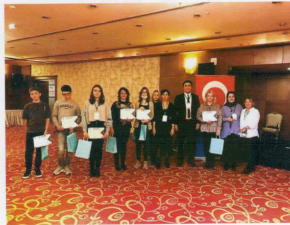
Veda yemeği, sertifika töreni ve hediyeleşme...