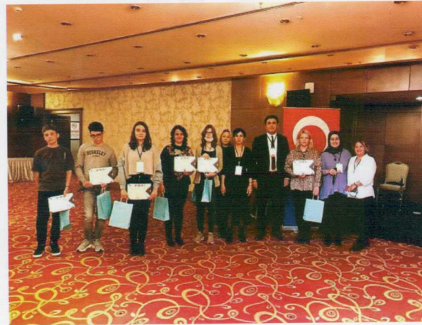
Veda yemeği, sertifika töreni ve hediyeleşme...